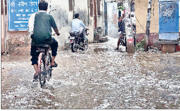
सोनीपत। वेस्ट रामनगर में जलभराव के बीच गुजरते लोग।