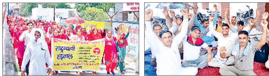
गोहाना। हाथों में बैनर लेकर सड़कों पर प्रदर्शन करते हुए कर्मचारी और गोहाना सब डिपो परिसर में घरने पर बैठे रोडवेज कर्मचारी

केंद्रीय ट्रेड यूनियनों के आह्वान पर बुधवार को राष्ट्रव्यापी हड़ताल में विभिन्न विभागों के भारी तादाद में कर्मचारियों, परियोजना वर्कर्स और मजदूरों ने सड़कों पर उतरकर प्रदर्शन किया। कर्मचारियों ने अपने विभागीय कार्यालयों में घरने भी दिए और सरकार के खिलाफ प्रदर्शन करके उनकी लंबित मांगों पूरी करने की मांग उठाई। राष्ट्रव्यापी हड़ताल में बिजली विभाग, जन स्वास्थ्य विभाग, नगर परिषद ग्रामीण सफाई कर्मचारी, आशा वर्कर्स, आंगनवाड़ी वर्कर्स, सिंचाई विभाग, वन विभाग,