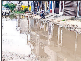
गन्नीर। बड़ी रोड पर भरे गंदे पानी से निकलते हुए वाहन।