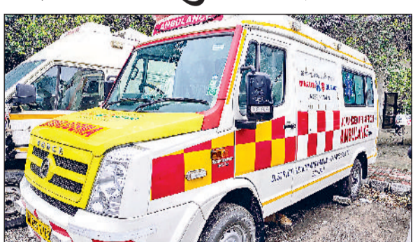
सोनीपत। अस्पताल परिसर में खड़ी दान की गाड़ी।

जिला नागरिक अस्पताल परिसर में करीब आठ माह से नई एंबुलेंस गाड़ी धूल फांक रही है। परिसर में खड़ी गाड़ी का इंश्योरेंस खत्म हो गया। उसका इंश्योरेंस करवाने के लिए प्रबंधन भागदौड़ में लगा हुआ है। साथ ही जानकारी मिली है कि गाड़ी के कागजात तक गुम हो गए हैं। गाड़ी की आरसी ट्रांसफर तक नहीं हो पाई है। जिसके चलते गाड़ी को सड़क पर मरीजों की सुविधा के लिए नहीं उतारा जा रहा है। जबकि एंबुलेंस बेड़े में कंडम हालत में पहुंच चुकी गाड़ियों को सड़कों पर दौड़ाया जा रहा है। बता दें कि जिले में मौजूदा समय में जिला स्वास्थ्य विभाग के पास कुल 30 एंबुलेंस जीवन वाहिनी मौजूद है। जिसमें