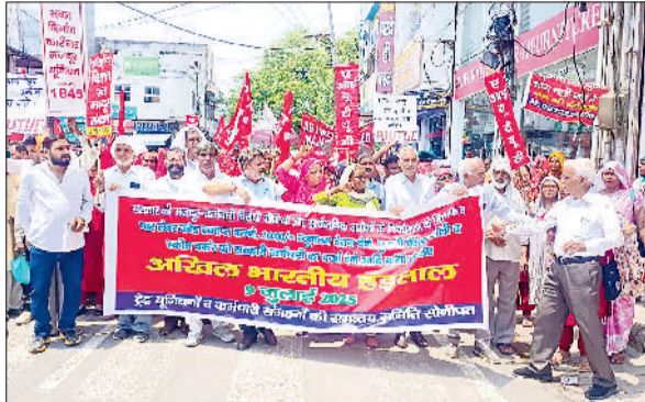
सोनीपत। हड़ताल के दौरान विरोध प्रदर्शन करते हुए संगठनों के पदाधिकारी एवं सदस्यगण।

को संबोधित करते हुए वक्ताओं ने कहा कि चार लेबर कोड लागू कर सरकार ने सभी पुराने श्रम कानून खत्म कर दिए हैं। अब कर्मचारियों से 8 की बजाय 12 घंटे काम लिया जाएगा। महिलाओं को रात में काम करने की अनुमति देने का निर्णय भी असुरक्षित है। फेक्ट्री अधिनियम में बदलाव कर अब मालिक 300 तक मजदूरों को बिना अनुमति हटा सकते हैं। यूनियन बनाना और आंदोलन करना पहले से भी कठिन कर दिया गया है। वक्ताओं ने कहा कि आशा, आंगनवाड़ी और मिड डे मील वर्कर्स को लंबे समय से सरकारी कर्मचारी का दर्जा देने की मांग की जा रही है, लेकिन सरकार उन्हें न तो कर्मचारी मान रही है और