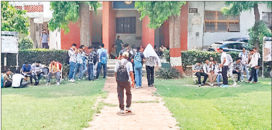
सोनीपत। हिंदू महाविद्यालय में दाखिला लेने पहुंचे विद्यार्थी।

महाविद्यालयों में दाखिलों की दौड़ के बीच स्नातक व स्नातक व स्नाकोत्तर पाठ्यक्रम के दूसरे व तृतीय वर्ष की कक्षाओं में दाखिला लेने वाले विद्यार्थियों के लिये पोर्टल खोला जा चुका है। जिसकी वजह से कॉलेजों में विद्यार्थियों की भीड़ पहुंचनी शुरू हो गई। पहले दिन प्रत्येक महाविद्यालय करीब 40 से 65 विद्यार्थी दाखिला लेने पहुंचे। वहीं स्नातक प्रथम वर्ष के लिये भी