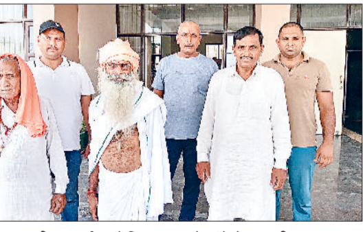
खरखौदा। एसडीएम कार्यालय में शिकायत करने पहुंचे रोहणावासी।