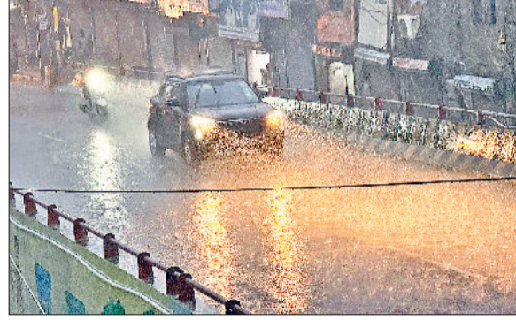
सोनीपत। गीता भवन आरओबी से गुजरते वाहन चालक।