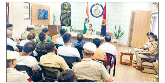
गोहाना। पेट्रोल पंप एसोसिएशन के प्रतिनिधियों के साथ चर्चा करते।