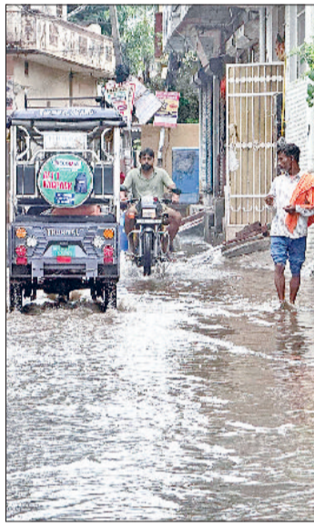
सोनीपत। वेस्ट रामनगर के हालात।

सुबह के समय सोनीपत शहर और राई क्षेत्र में बादल जमकर बरसे। मुख्य मार्गों से लेकर गली-गोदलों तक पानी भर गया। वहीं, दोपहर होते होते बारिश तो दूर बादल भी गायब हो चुके थे, जिसकी वजह से तेज धूप निकल आई। तेज धूप और वातावरण में नमी होने के कारण उमस भरी गर्मी ने लोगों को बेहाल कर दिया। हालांकि दोपहर के समय खरखोदा क्षेत्र में अच्छी बारिश हुई थी। इसी बीच शाम होते होते एक बार फिर आसमान बादलों से ढक गया और 7 बजे से पहले फिर से बारिश शुरू हो गई।