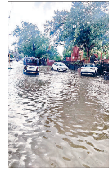
खरखोदा। थाना कलां मार्ग पर जमा पानी।

खरखोदा। बुधवार सायं खरखोदा में जमकर बरसे बरसात। जिससे शहर के सभी मार्ग तालाब में तब्दील हो गए। जल निकासी व्यवस्था ढंग की एक बारिश नहीं झेल पाई। दिल्ली मार्ग, थाना कलां मार्ग रोहतक मार्ग, सांपला मार्ग व अन्य मार्ग पानी में डूब गए। पुरानी तहसील का मुख्य द्वार, खंड विकास एवं पंचायत कार्यालय परिसर, बस अड्डे व अनाज मंडी के दोनों द्वार के साथ साथ अन्य कार्यालयों में जल भराव हो गया है। मुख्य मार्ग से निकलते स्तर की गलियों में भी पानी जमा होने से लोगों को परेशानी हुई।