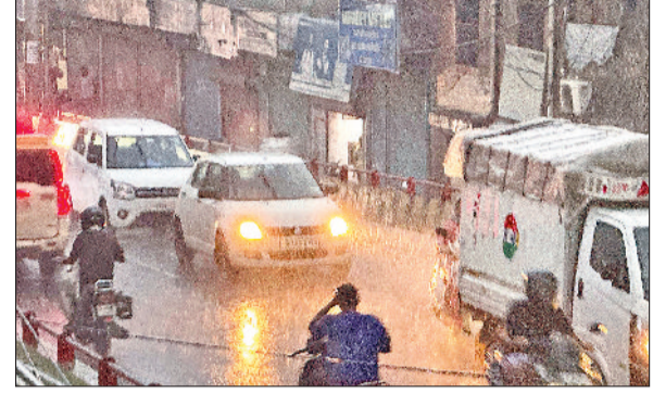
सोनीपत। वाहन चालकों को दिन में लाइट जलाकर गुजरना पड़ा।